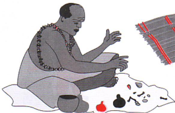
Pronostikado di Tempu

Den nos próksimo edishon, nos ta sigui ku e parti ost di Afrika.