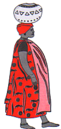
Kargado di Awa