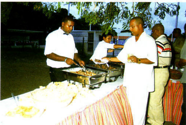
... loke tur presente a hasi ku smak tambe!