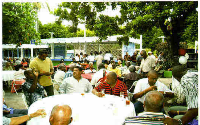
Di tur kaminda nos miembronan a bini i duna akto di presensia.