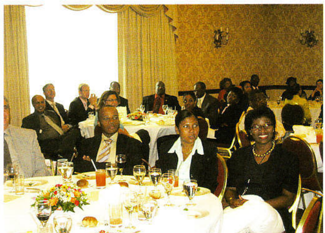
Hopi a akudí na e elegante fundraising lunch di KEP.