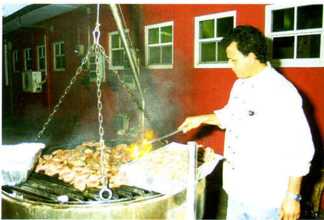
Naturalmente mester sistu e stoma tambe...