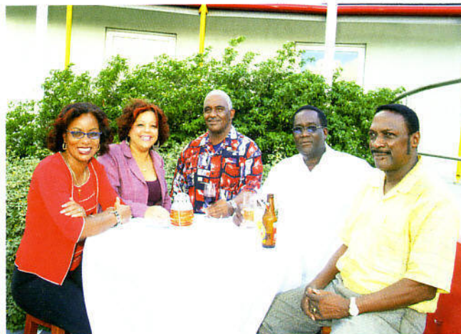
.... den bon kompania ...