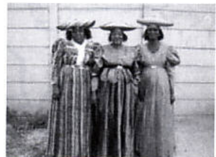
Hende muhënan Herero na Windhoek, Namibia

Habitante 43.6 Mion Kapital Pretoria Idioma Ingles Moneda Rand