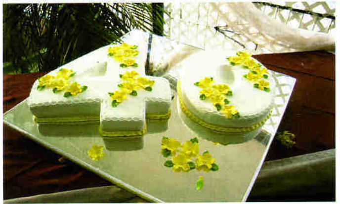
Esta un beyesa ....