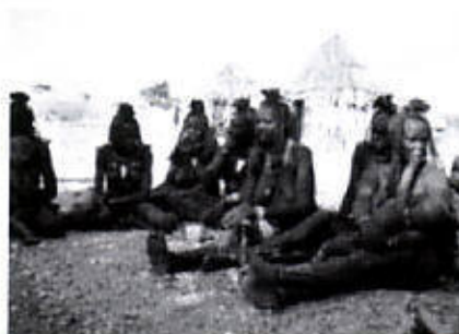
Hendenan muhé Himba na Namibia

Habitante 1.1 Mion Kapital Mbabane Idioma Ingles Moneda Lilangeni