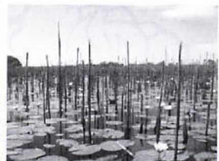
Okavango Delta, Botswana

Habitante 2.2 Mion Kapital Maseru Idioma Ingles Moneda Loti