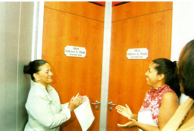
Sala Federico Thodé, un prenda den edifisio di KEP