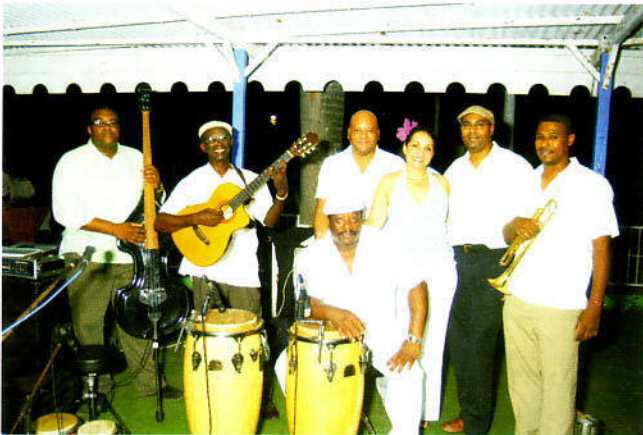
Pa deleite di tur, Son de Cuba a toka e notanan pa hende haña gana di marka paso.