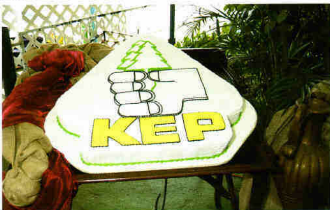
E bolonan no por falta.