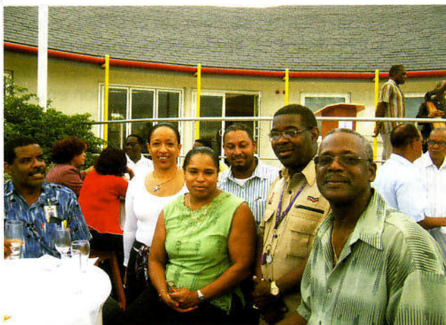
Disfrutando di un atardi ameno