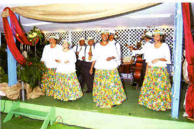
Grupo Serenada a duna un serenada di bèrdè!