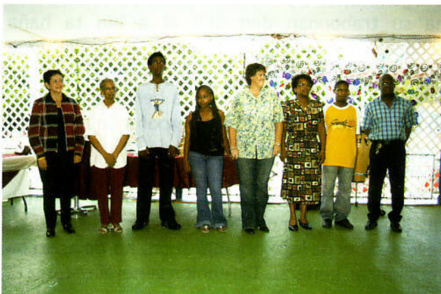
Bekadonan di KEP i nan lidernan tambe tabat'ei!