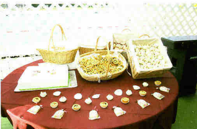
Kos di boka dushi krioyo pa nos miembronan saboriá!